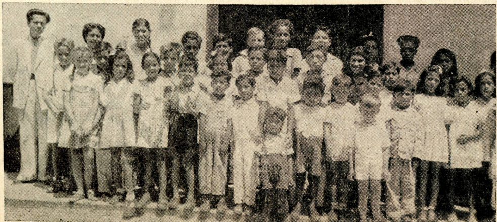
Hermoso grupo de alumnos que asistieron a una Escuela Bíblica Vacacional en Praitá, Perú, América del Sur.

¿Es posible que no haya nadie con la visión, la fe y el amor de Esther Carson Winans? ¿No hay nadie que posea el mismo valor de Roger Winans? Alguien estará dispuesto a dar su vida. Alguien más querrá dar su dinero. La historia más conmovedora de una aventura nazarena no será jamás una carga de tristeza y de vergüenza.