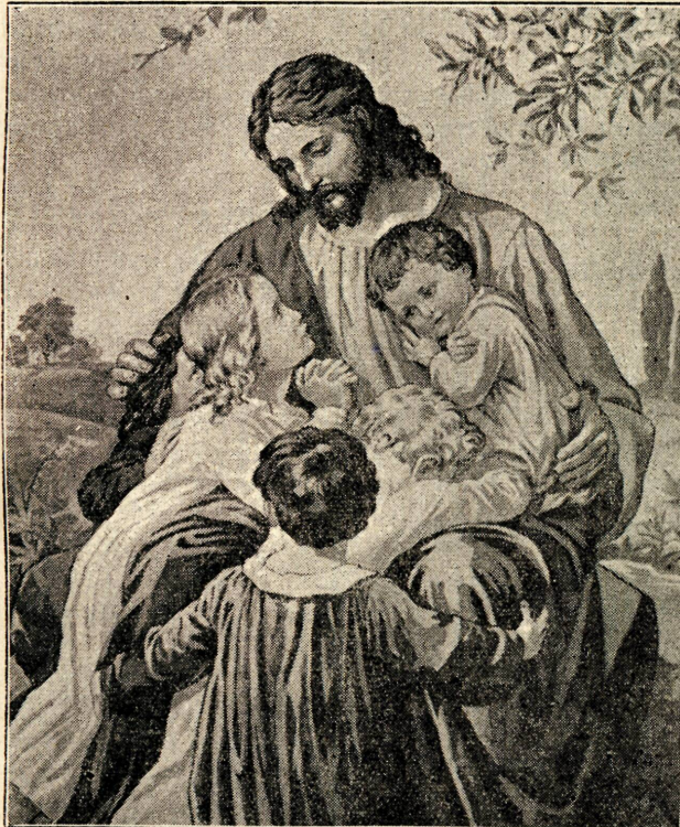
JESUS RECIBE LAS CARICIAS INFANTILES